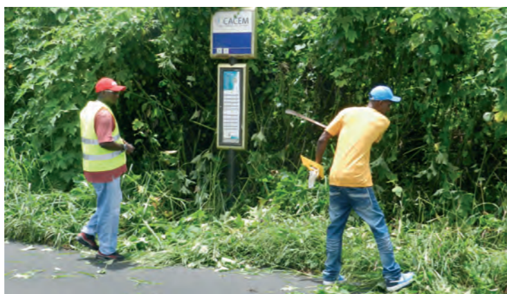
L'Agglomération Centre pour le compte de la CFTU (Compagnie Foyalaise de Transport Urbain).

La structure emploie 5 agents permanents et 3 à 4 saisonniers par an. Avant de débuter le travail d'insertion, un travail avec des psychologues permet d'insister sur la durée de cet accompagnement. Une qualification après deux ans est envisageable sans aucune obligation de recrutement définitif.